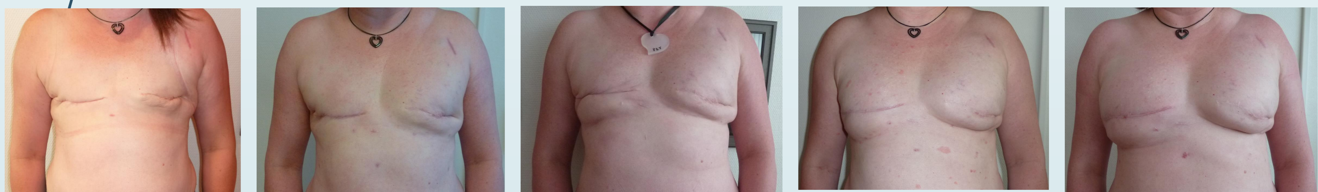
RMD sein droit, RMI sein gauche, 5 séances (collection SLM)