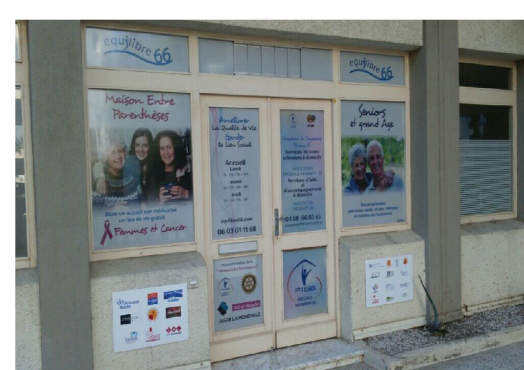
La Maison entre Parenthèses (Equilibre 66) Perpignan