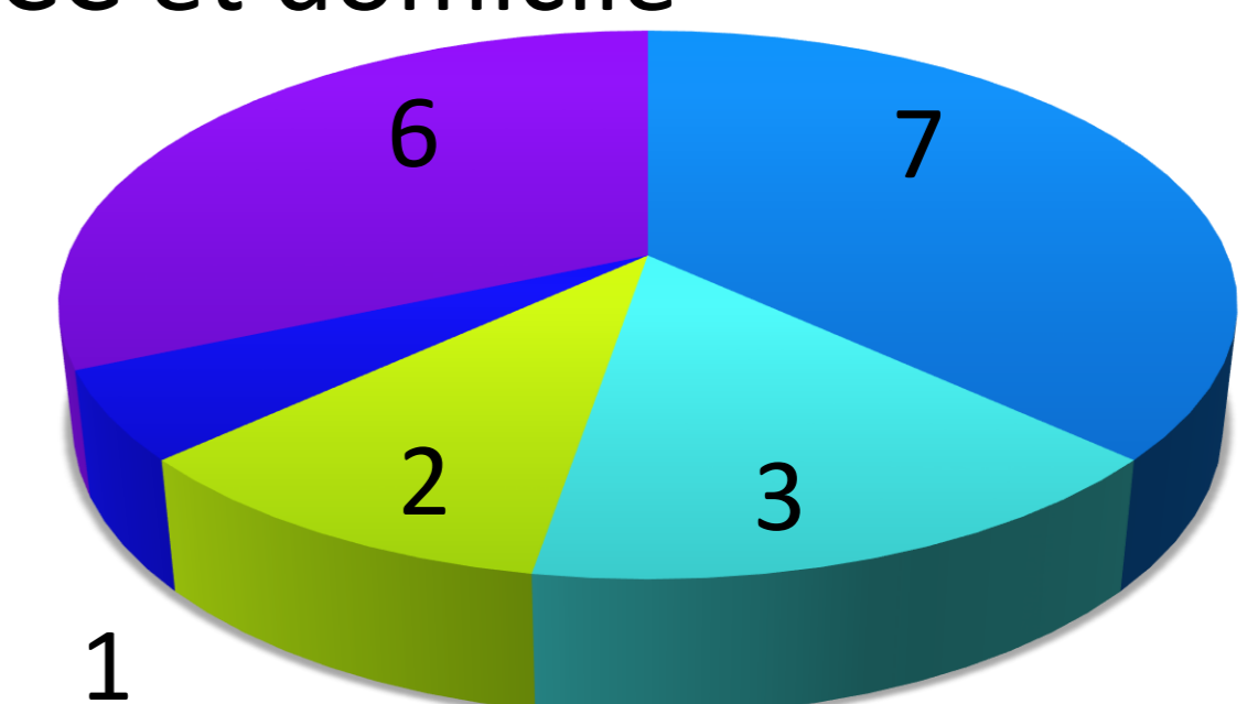
Nombre moyen de patients par atelier socle